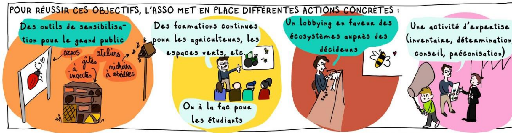
Illustration Anne Belot